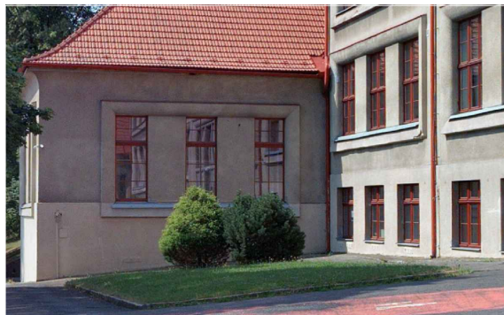
FOTO - STÁVAJÍCÍ STAV