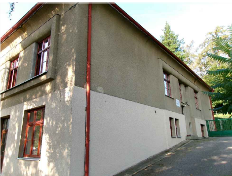
FOTO - STÁVAJÍCÍ STAV